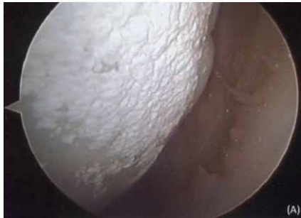
JF Baker, et al: Arthritis Rheum 62: 895, 2010